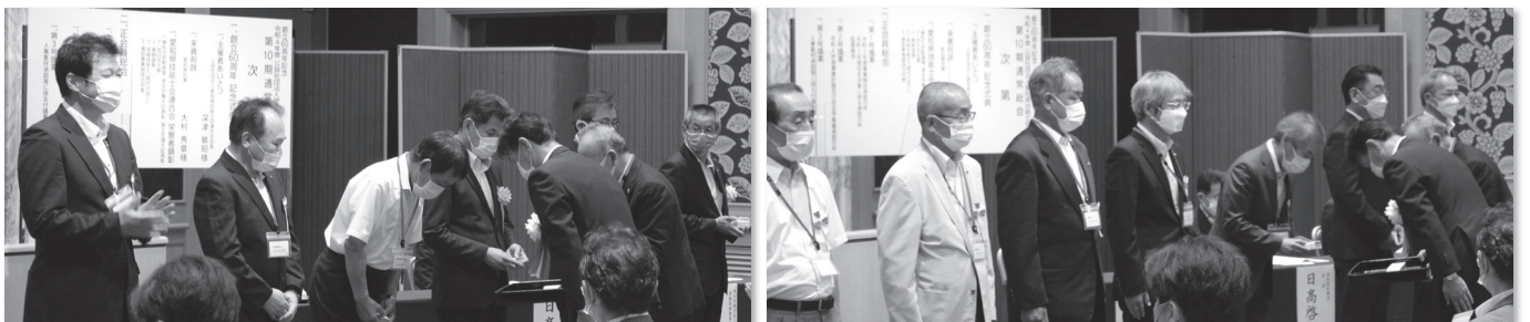
表彰者記念品授与